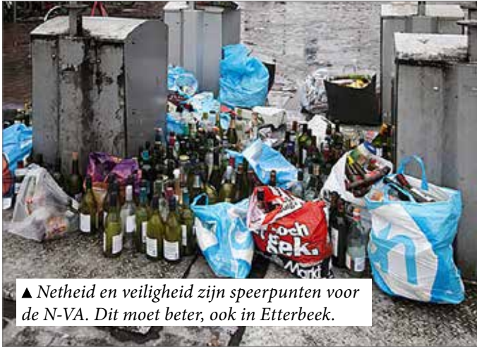
▲ Netheid en veiligheid zijn speerpunten voor de N-VA. Dit moet beter, ook in Etterbeek.