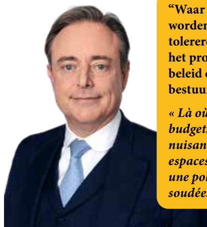
N-VA-VOORZITTER | PRÉSIDENT DE LA N-VA Bart De Wever

“Waar de N-VA bestuurt, krijgen ondernemers vertrouwen, worden budgetten beheerd als door een goede huisvader en tolereren we geen criminaliteit of overlast. Waar wij besturen is het proper en voldoende groen, voeren we een rechtvaardig sociaal beleid en bouwen we aan hechte gemeenschappen. Waar de N-VA bestuurt, voelen mensen zich thuis.”